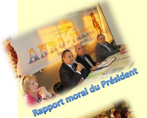
Rapport moral du Président