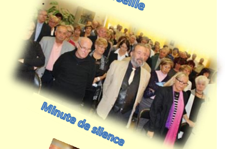
Minute de silence