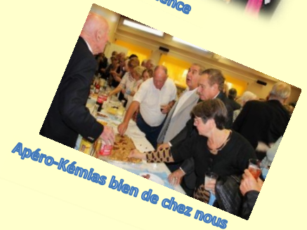
Apéro-Kémiás bien de chez nous

Organigramme Conseil d'Administration 2013-2015