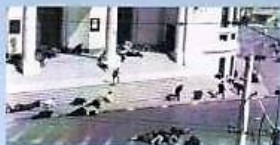
L'escalier de la Grande Poste